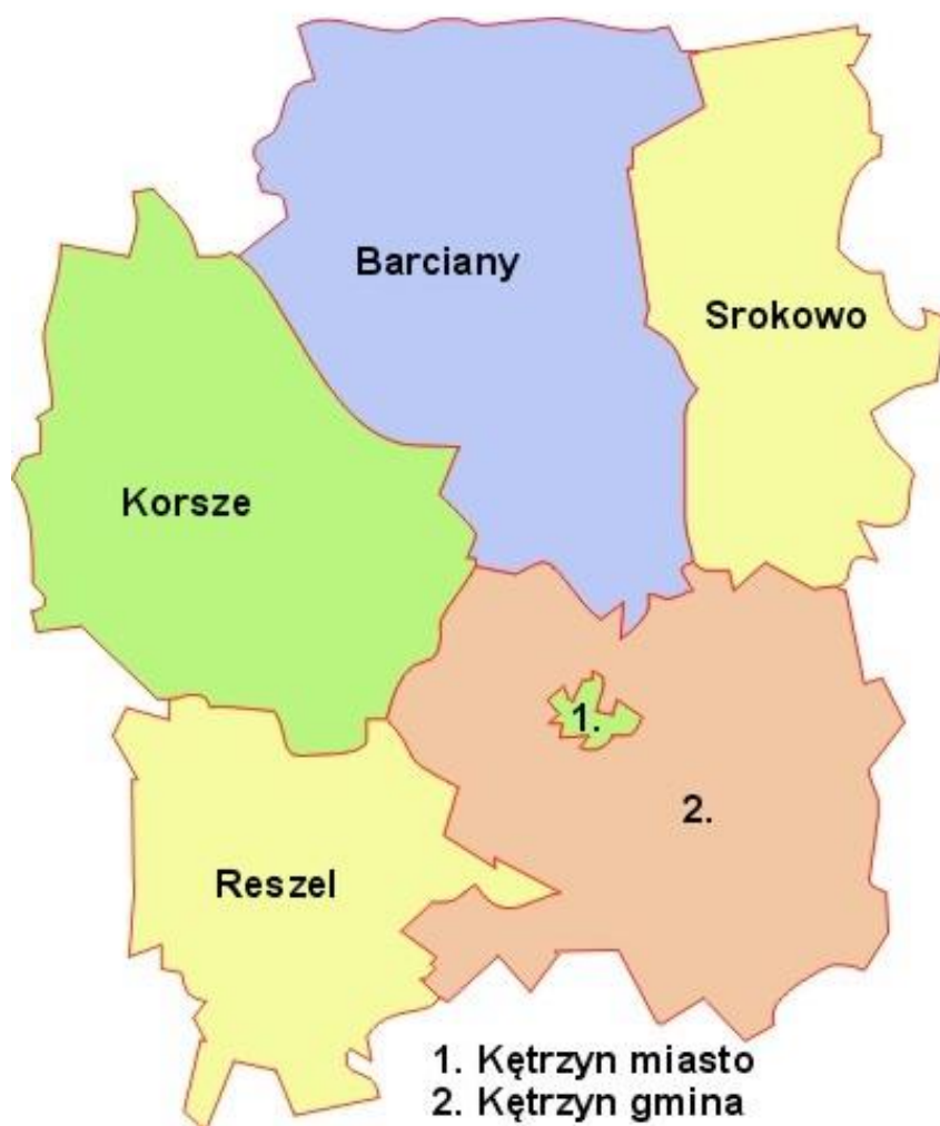
Położenie Gminy Reszel na tle powiatu kętrzyńskiego

całej Gminy jest miasto Reszel. Pozostałe miejscowości zamieszkiwane są przez niewielki odsetek ludności. Najmniejsze liczą kilku, największa wieś to Łężany - 339 mieszkańców. Wśród miejscowości liczących powyżej 200 osób należy wymienić pięć największych miejscowości Gminy: Łężany, Pilec, Leginy, Klewno, Pieckowo, które skupiają ponad 40% ludności terenów wiejskich Gminy Reszel.